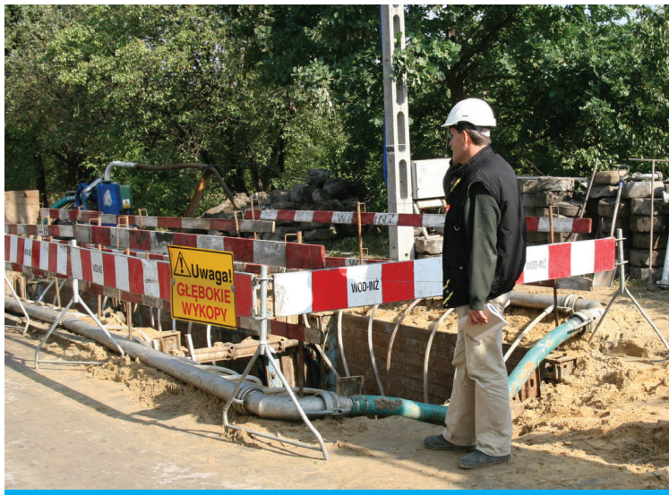
Miejsce robót ziemnych należy ogrodzić i oznakować